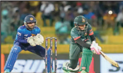
एशिया कप में मुश्फिकुर रहीम

बीसीबी ने छुट्टियां बढ़ाईं, ताकि वे नवजात बच्चे को समय दे सकें